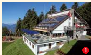
Albergo Ristorante Cardada Tel. +41 (0)91 751 35 95 ristorantecardada@gmail.com