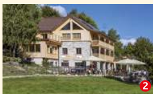
Casa Colmanicchio Tel. +41 (0)91 751 18 25 info@colmanicchio.ch

Salade fitness à la Colmanicchio ou plat du jour Fitness salad Colmanicchio style or daily menu