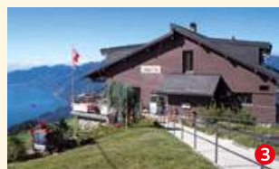
Capanna Cimetta Tel. +41 (0)91 743 04 33 davito.capanna.cimetta@gmail.com

Salade fitness à la Colmanicchio ou plat du jour Fitness salad Colmanicchio style or daily menu