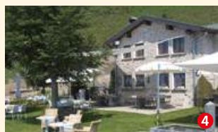
Capanna Lo Stallone Tel. +41 (0)91 743 61 46 capanna@stallone.ch

Salade et plat du jour Salad and daily menu